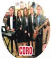
CORO VIRGEN DE LA NUBE