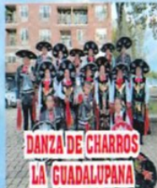
DANZA DE CHARROS LA GUADALUPANA DE HUAUCHINANGO PUEBLA